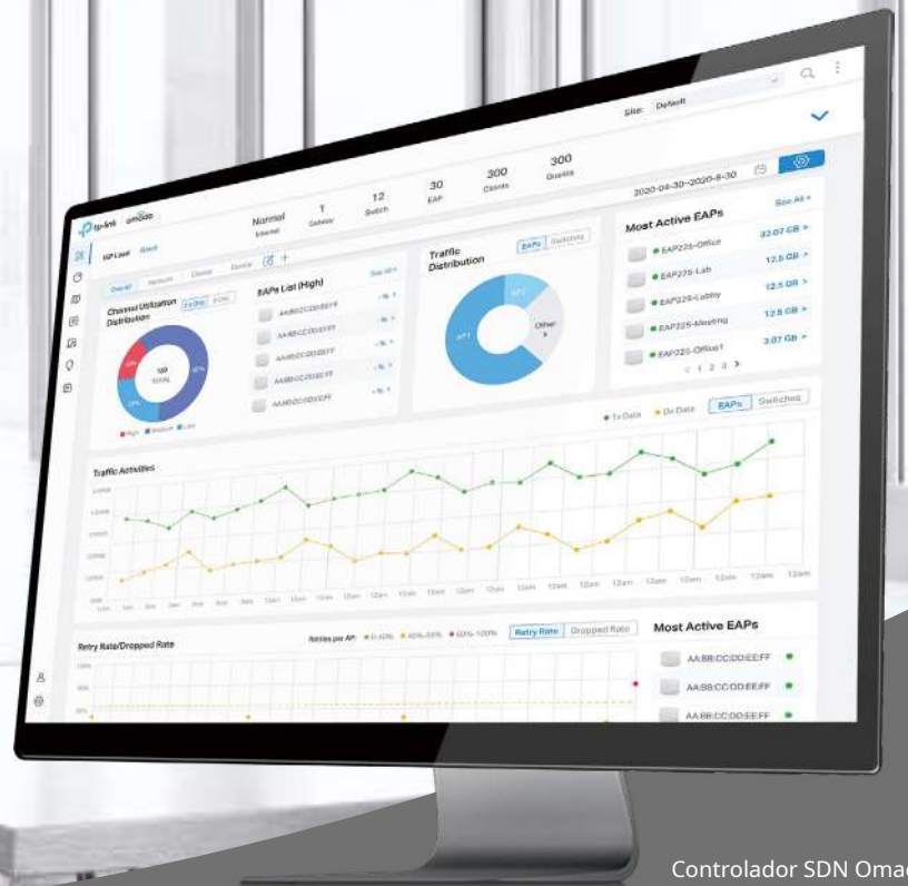
Controlador SDN Omada