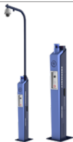
DS-PEA3M-21(H) Estación de alarma de pánico de poste